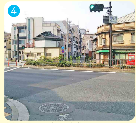
高松西信号を渡って直進